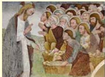
Il segno della moltiplicazione dei pani